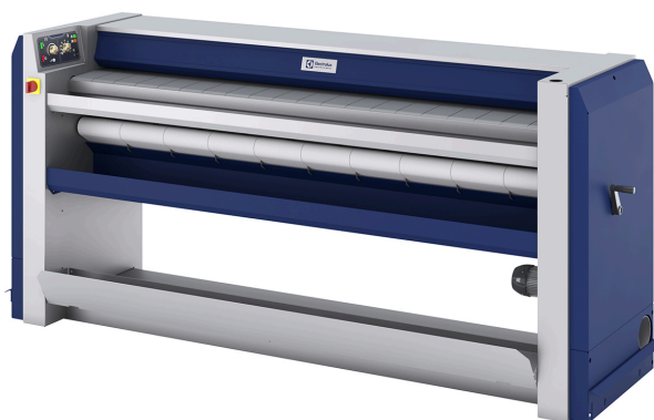
Ilustracje służą wyłącznie przedstawieniu produktu, możliwe jest występowanie rozbieżności.